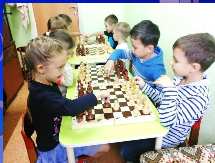
«ШАХМАТЫ И ШАШКИ»